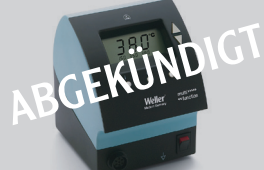
WD 1 plus Sets