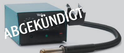
WHA 900 HEISSLUFTSTATION