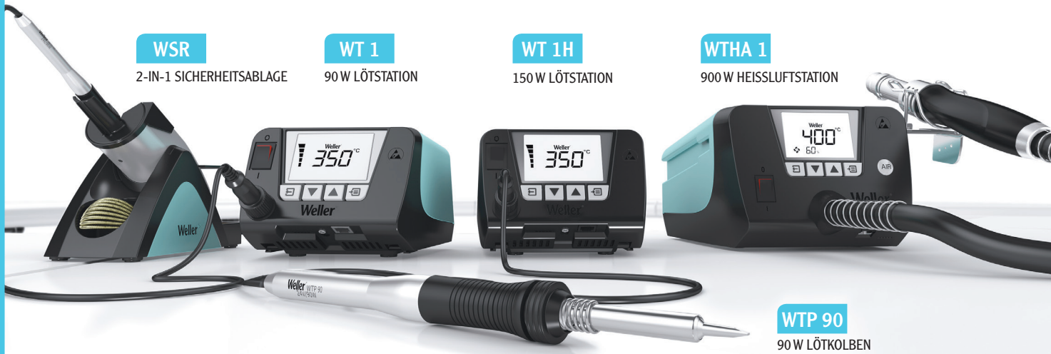
WSR 2-IN-1 SICHERHEITSABLAGE