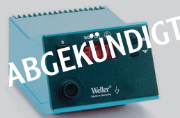
WSD 151, WSD 151R, WSD 121 plus Sets