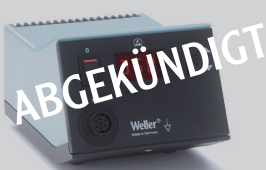
WSD 81, WSD 81i plus Sets